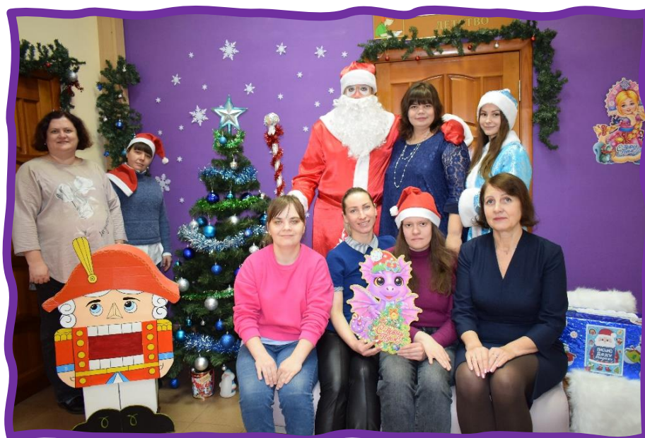
Основные события года